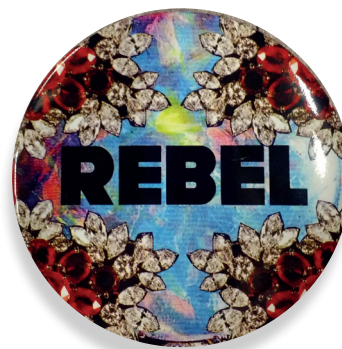
Rebel, button, Bas Kosters, 2013

Button maken geïnspireerd op het werk van kunstenaar Bas Kosters.