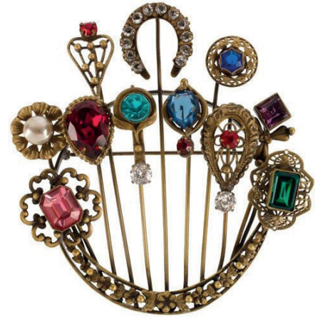
broche, Josef of Hollywood

Welke materialen inspireren sieradenmakers? (bijvoorbeeld: waardeloos materiaal, levend materiaal of natuurlijk materiaal) Waarom wordt er gekozen voor deze materialen door de sieradenmaker?